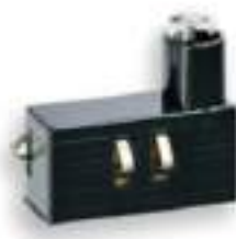
00931 - Unità precablata LED 110-250V 0,5W ambra