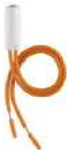
00936.250.A - Unità segnal. LED 250V 0,35W ambra