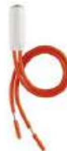
00936.250.R - Unità segnal. LED 250V 0,35W rosso