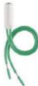
00936.250.G - Unità segnal. LED 250V 0,35W verde