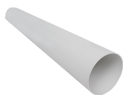
TUBO PVC D.100 L=700 (HRW 30) Codice 21879