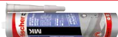
Adesivo di montaggio MK