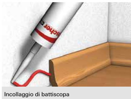
Incollaggio di battiscopa